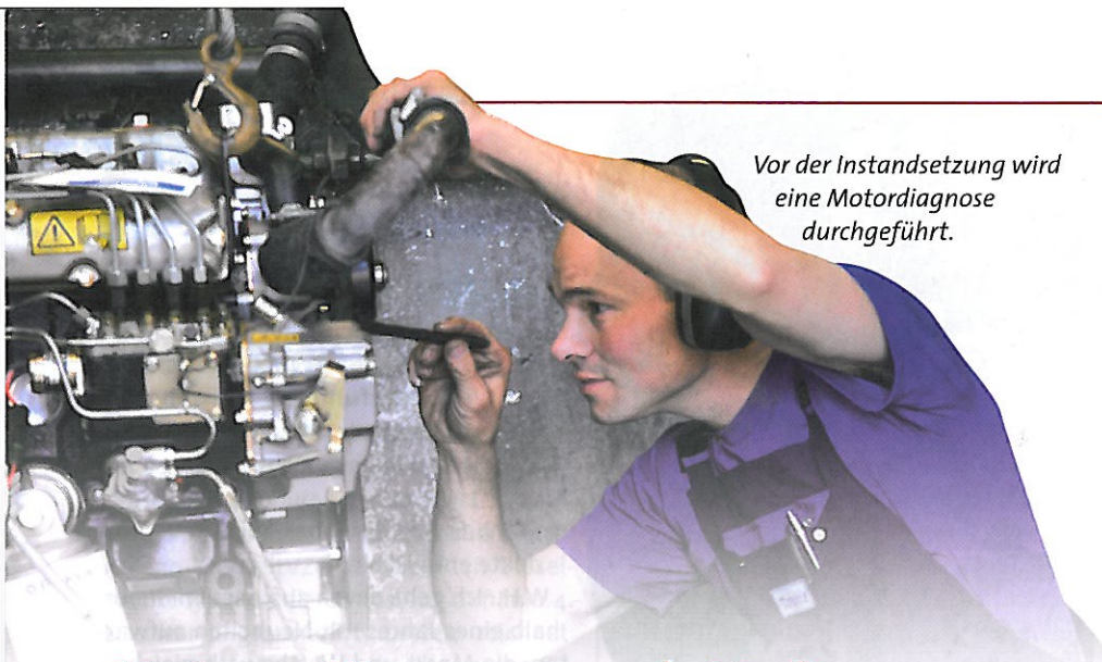
Vor der Instandsetzung wird eine Motordiagnose durchgeführt.